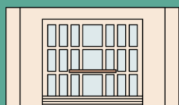
DOM KULTÚRY PARTIZÁNSKE

Mestskej umeleckej agentúry v Partizánskom ZA ROK 2023